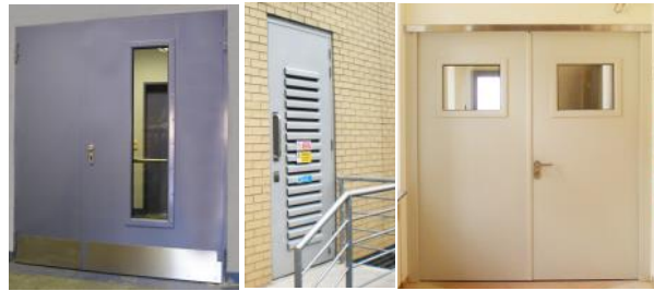
Türen erhältlich in vielen verschiedenen Modellen.