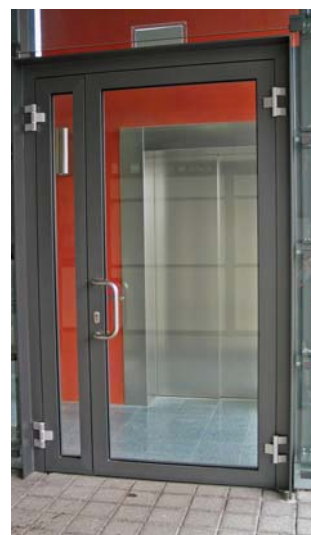
Fotos: Schutz gegen Feuer und Rauch, schickes Design und Transparenz durch einen hohen Glasanteil; für den Innen- und Außenbereich geeignet.