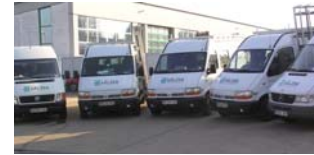
Heute hat SÄLZER mehr als 10 Montage- und Wartungsfahrzeuge sowie 2 LKW im Einsatz.