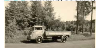
Der 1. SÄLZER LKW aus den 50er Jahren.

Auch bei diesen Sicherheitskonstruktionen ist der Besitzer gemäß der Richtlinie DIBt gesetzlich verpflichtet, die Anlage jährlich zu warten. SÄLZER empfiehlt auch die übrigen Brandschutztüren in Abhängigkeit von der Nutzungshäufigkeit warten zu lassen. Durch den professionellen Check, z.B. von Riegel und Falle, wird sichergestellt, dass die Tür im Ernstfall auch wirklich schließt.