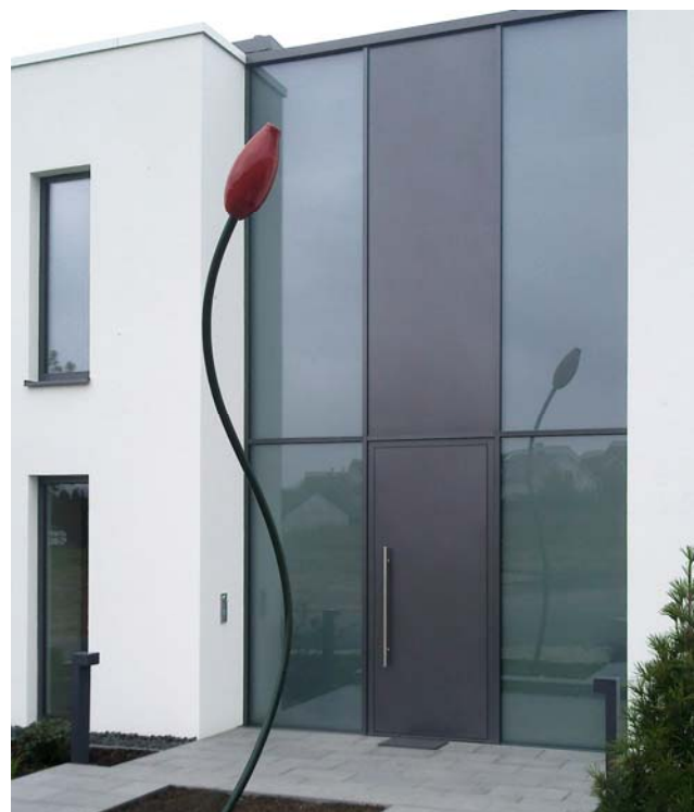
Foto: flächenbündige Tür, kombiniert mit einer eleganten Fassade in Glas und Aluminium, garantiert einen repräsentativen Eingangsbereich.

Die SÄLZER Produkte sind auch in Kombination mit Einbruchhemmung erhältlich.