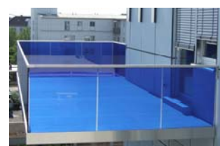
Fotos rechts: verglaste Trennwand, ermöglicht eine flexible und transparente Raumtrennung. Gittertür individuell gestaltet. Treppengeländer aus Aluminium, Balkongeländer aus farbiger Verglasung.