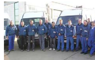
Das erfahrene Montage- und Wartungsteam.